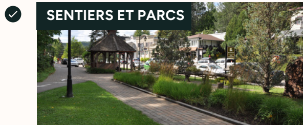
Aménagement de sentiers de randonnée.