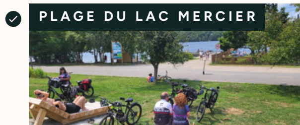
Développement d'un concept d'aménagement du site.