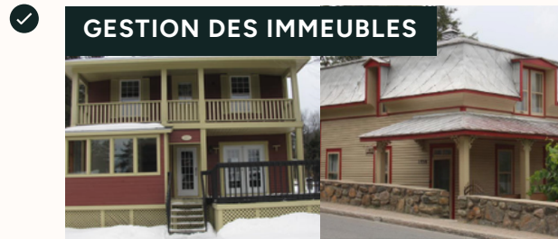
Ancien Baril roulant (1885-1887, ch. du Village) et Chalet Charlie (1850, ch. du Village)