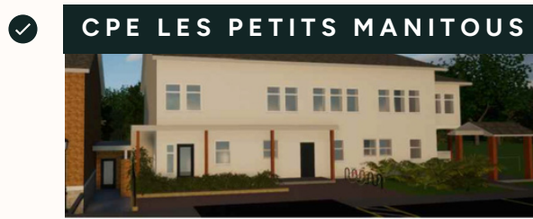
Projet d'agrandissement sur un terrain de la Ville. Sera complété en 2027.