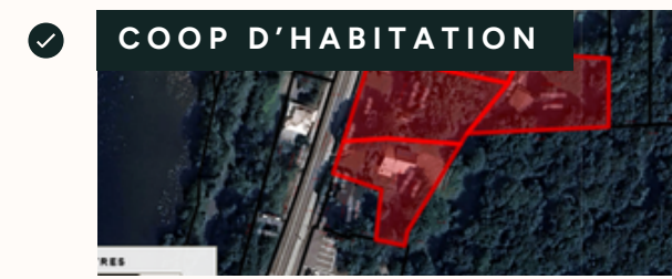
Étude d'opportunité et processus d'approbation réglementaire.