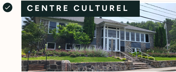
Vocation de l'édifice Félix-Calvé (1875, ch. du Village).